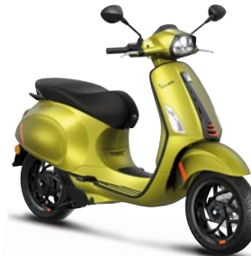
Grün Ambizioso matt V03