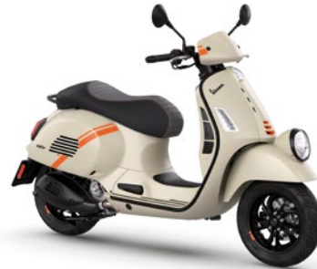
Beige Avvolgente matt Q03