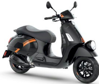
Schwarz Convinto XN2