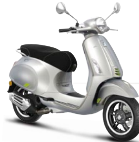
Grau Entusiasta G41