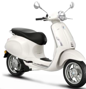
Weiß Innocente B04