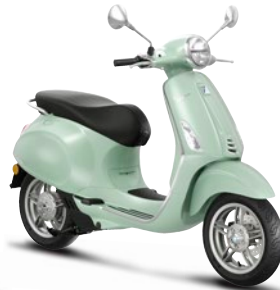
Grün Amabile VK (350/A)