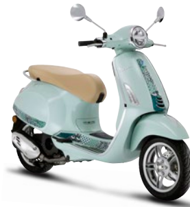
Grün Batik VK (350/A)