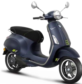
Blau Energico matt DY