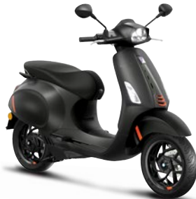
Schwarz Convinto matt NV