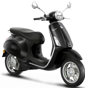
Schwarz Convinto XN2 (98/A)